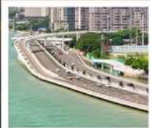
สะพานเหยียนหฺวู่เฉียว