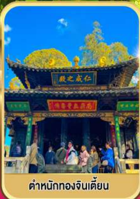
ตำหนักทองจินเตียน