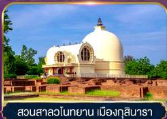
สวนสาละวินทยาน เมืองกุสินารา