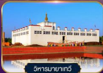
วิหารมายาเทวี