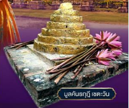
มูลคันธกุฎี เขตเววัน