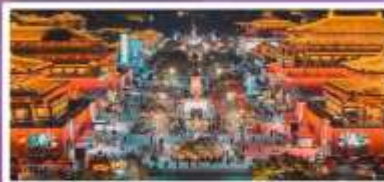
ถนนวัฒนธรรมราชวงศ์ถัง