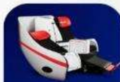
ที่นั่งพรีเมียมแฟลตทอป

บริการอาหารร้อน และ น้ำดื่ม บนเครื่อง ขาไป และ ขากลับ