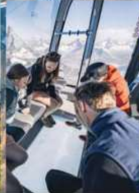
Matterhorn Glacier Paradise