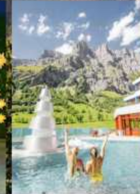
แช่สปปาลอยเทอรันา