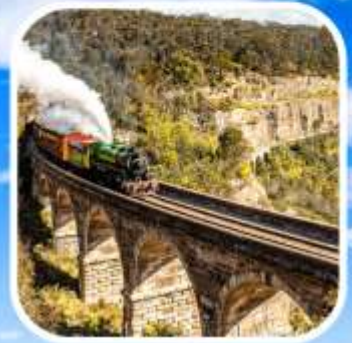
ZIG ZAG RAILWAY