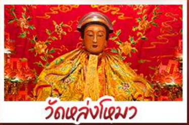
วัดเล่งนิต