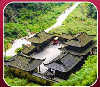
"อุทยานหลุมฟ้า"

T2G-CKG34(3U) The Best Chongqing...ฉงชิ่ง ต้าจู้ อุ่หลง เขานางฟ้า 5D 4N (3U)