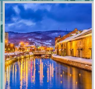
“OTARU CANAL FEST”