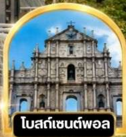
โบสถ์เซนต์ฟอล