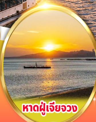
หาดผู้เจียวจง