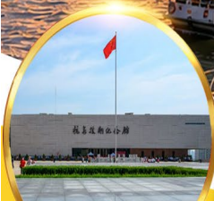
พิพิธภัณฑ์สงคราม เกาหลีตานตง