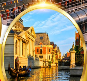
Venice Water City