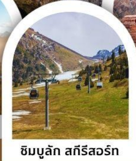
ซิมบูลัก สกีรีสอร์ท