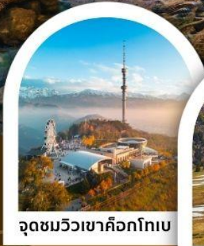
จุดชมวิวเขาค็อกโทเบ