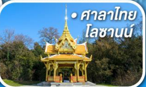
• ศาลาไทย ไอชานน์

• สุดอากาศดีที่เซอร์แมท • ขึ้นกระเช้าสู่ยอดจากกลาเซียร์ 3000 • ชมเมืองคลาสสิกเบิร์น ลูเซิร์น ซูริก