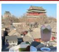
คาเฟ่ น้ำตาล