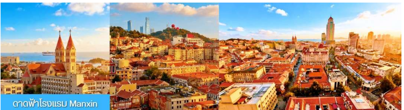
ดาดฟ้าโรงแรม Manxin

กลางวัน อิสระอาหารเพื่อให้ท่านมีความสุขในการเดินช้อปปิ้ง และท่านสามารถเลือกชิมอาหารพื้นเมืองตามอัธยาศัย จนได้เวลาอันสมควร ตามเวลานัดหมาย นำท่านเดินทางสู่ ถนนหลงเจียงลู่ ให้ท่านถ่ายรูป ถนนหลงเจียงลู่ ถนนสายการ์ตูน อะนิเมะ น่ารัก ๆ เหมาะกับการถ่ายรูป เช็คอิน