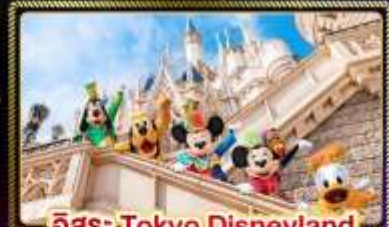
อิสระ Tokyo Disneyland