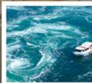
คลองเรือขมบ้านนาสุโตะ

คลองเรือขมบ้านนาสุโตะ / ซุปบึงย่านชินโซบาช / ตลาดปลาคุโรเมง / ซุปบึงย่านอุมาเดะ