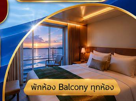
พักห้อง Balcony ทุกห้อง