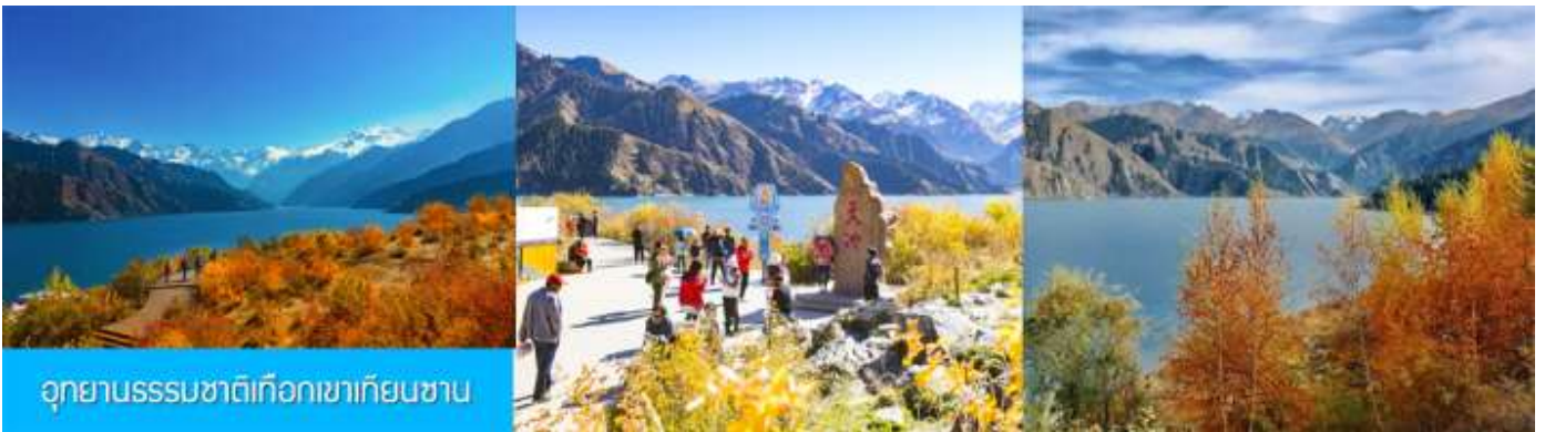
อุทยานธรรมชาติเทือกเขาเทียนชาน

เช้า รับประทานอาหารเช้า ณ ห้องอาหารของโรงแรม (7)