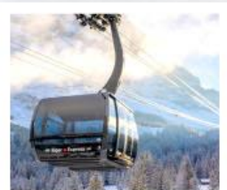
ขึ้นกระเช้ายอดเขาจุงเฟรา