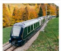
รถไฟโกลด์นพาส