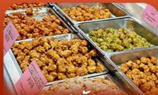
ตลาดบึงวอน