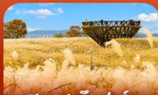
สวนฮานิลปาร์ก