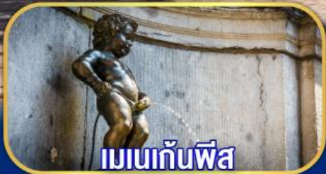
เมนกันพีส