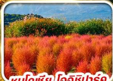
ชมโคเชีย โออิชิปาร์ค