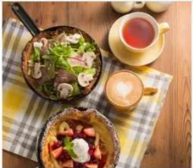
Gourmet Grace Garden Nature Grace Garden 1F[1095]