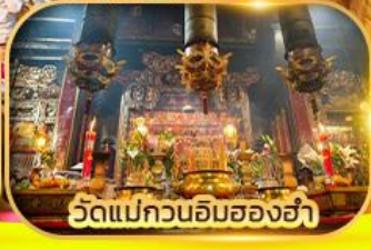
วัดแม่กวนอิมสองห้า