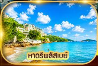
หาดริพลัสเบย์