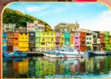
ท่าเรือประมงเจิ้งปิ่น